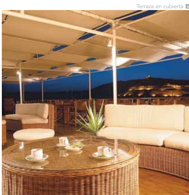
Terraza en cubierta

Billete de avión de Egyptair en clase turista «H» Una noche de alojamiento en el Sofitel Old Winter Palace de Luxor, en habitación Deluxe Nile View, desayuno incluido Dos noches de alojamiento en el hotel Four Seasons Cairo at Nile Plaza, en habitación Nile View, desayuno incluido Cuatro noches de crucero por el Nilo a bordo de la M/N Alexander the Great, en cabina Suite, incluyendo pensión completa Guía local acompañante de habla hispana durante todo el viaje Todos los traslados, visitas y excursiones indicadas en servicio privado.