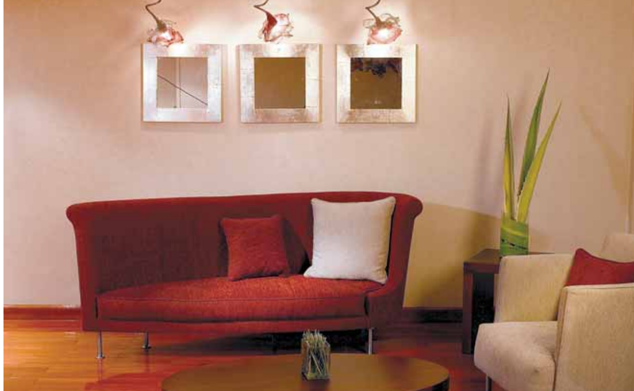
Alexander The Great | Reception