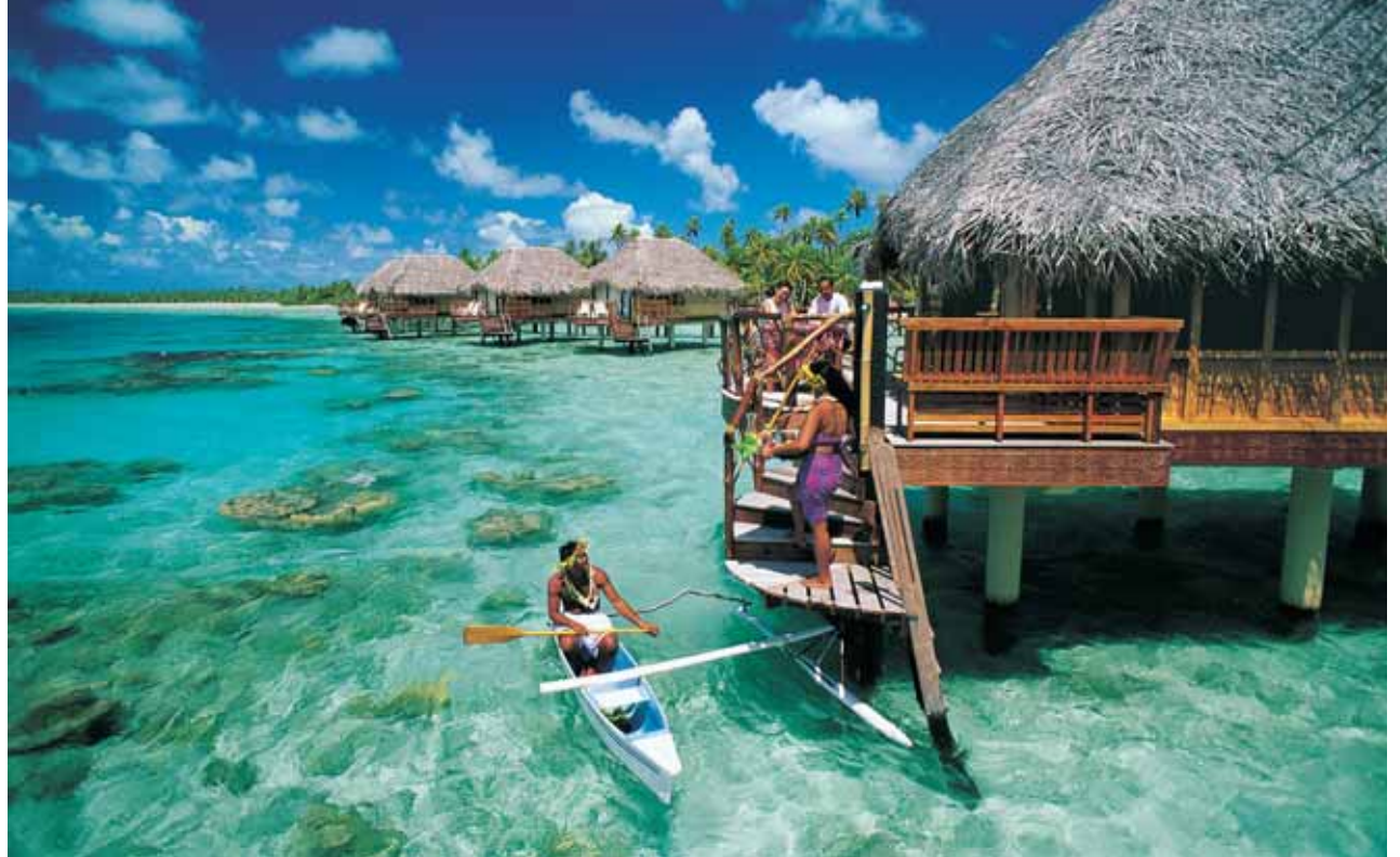
Manihi Pearl Beach Resort | Overwater Bungalows