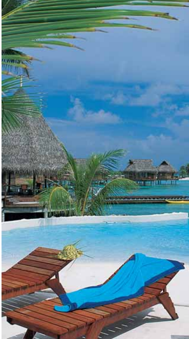
Tikehau Pearl Beach Resort | Swimming Pool