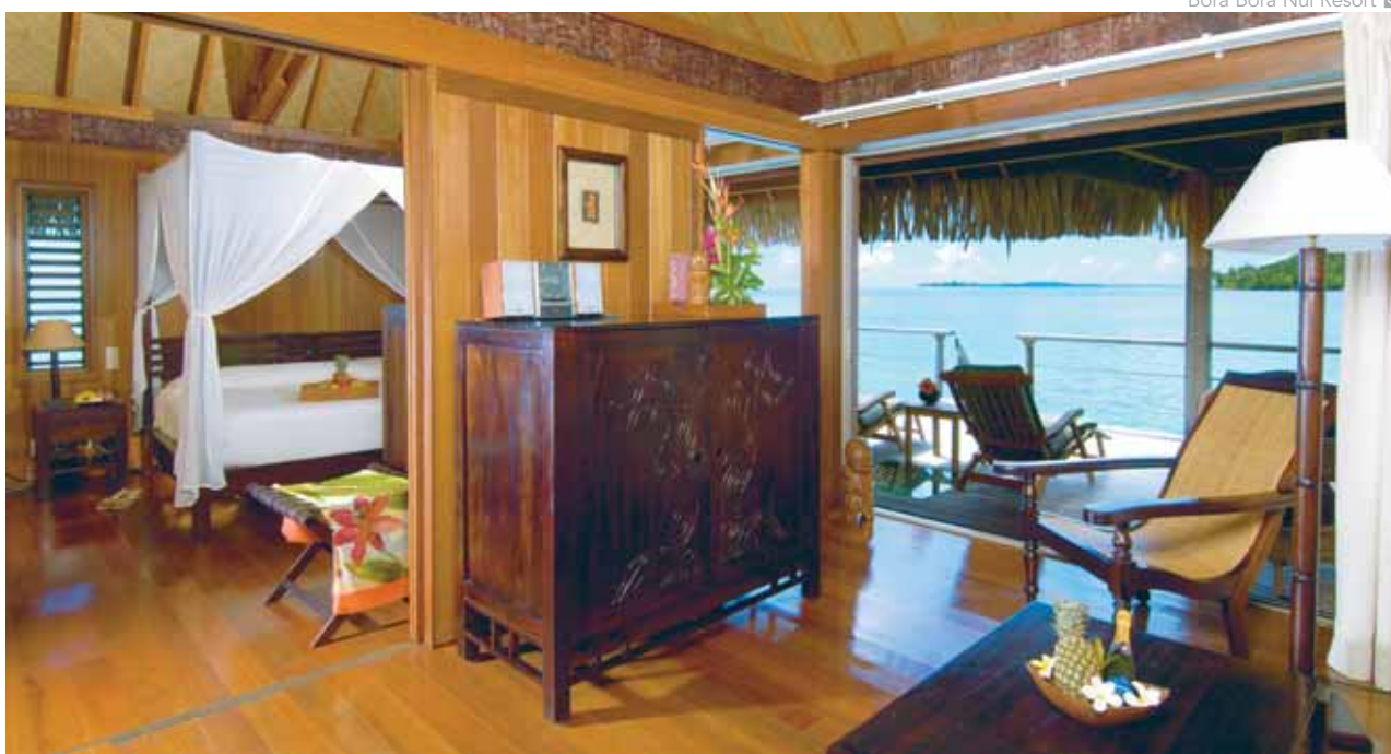
Bora Bora Nui Resort ↓

Día 12. España. Llegada y fin de nuestros servicios.