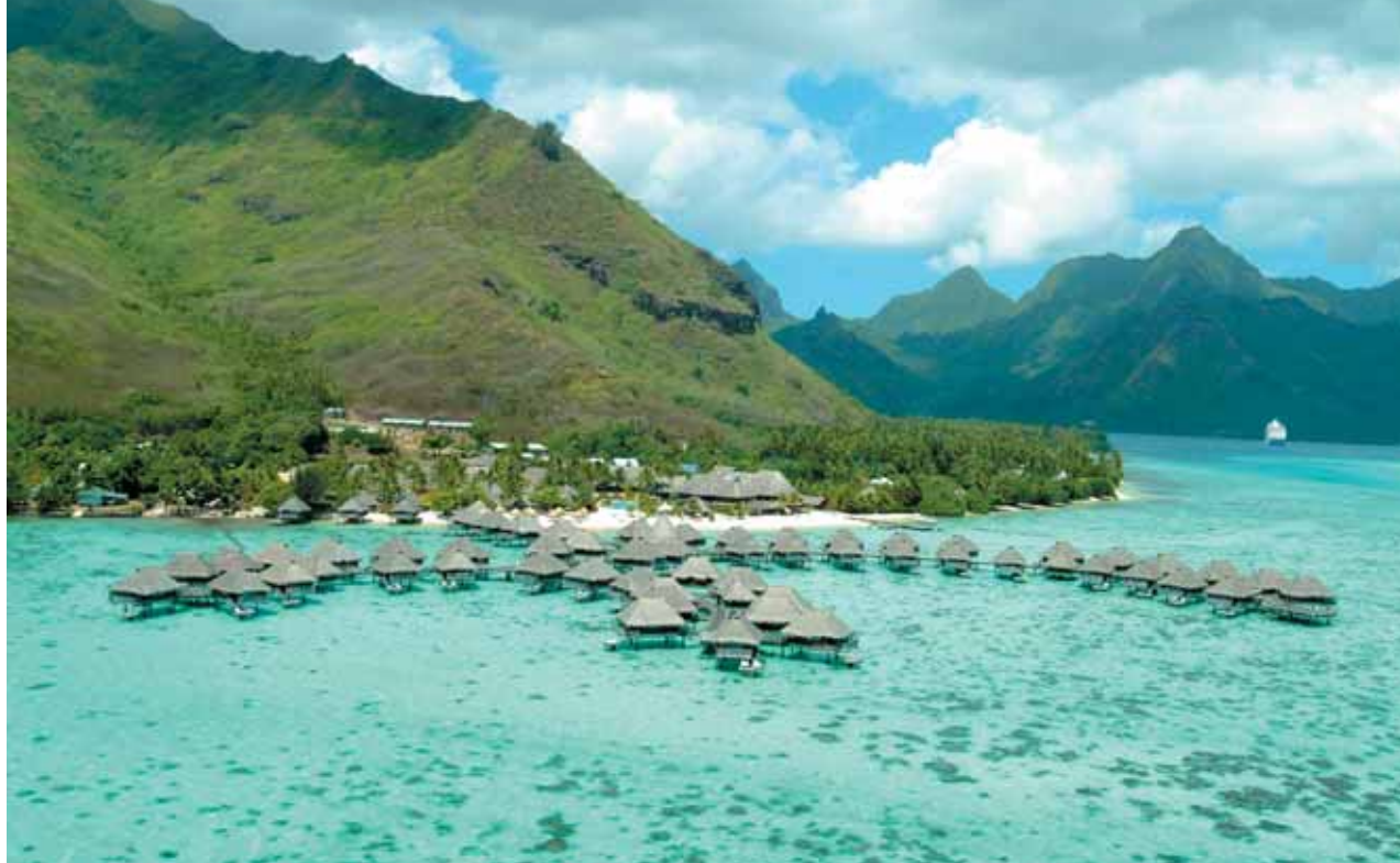
↑ Sheraton Moorea Lagoon Resort & Spa