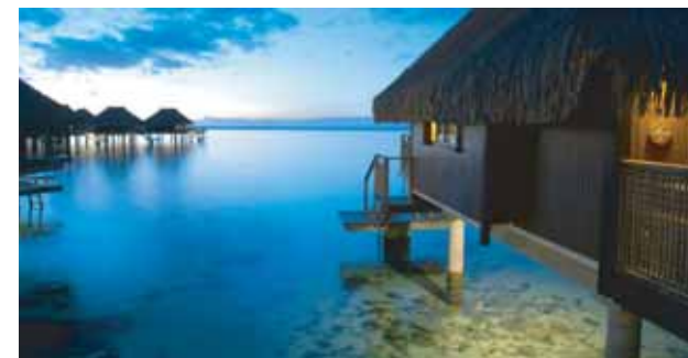
↑ Sheraton Moorea Lagoon Resort & Spa