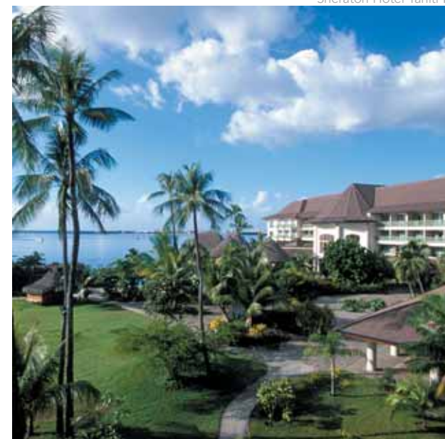
Sheraton Hotel Tahiti ↓