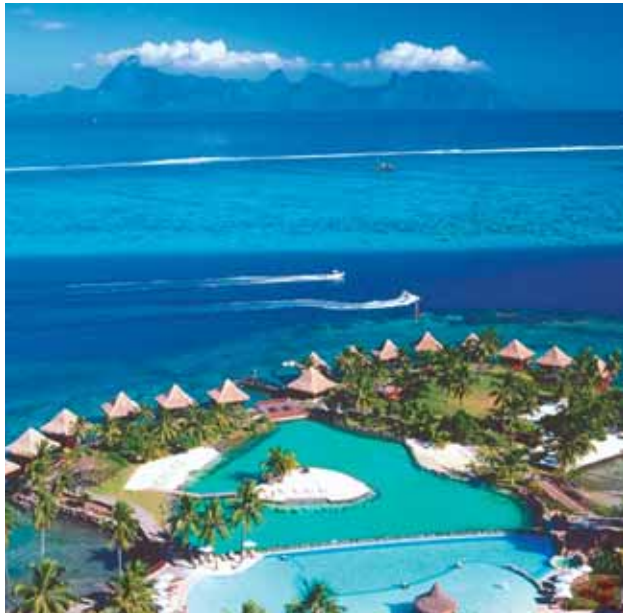
InterContinental Resort Tahiti