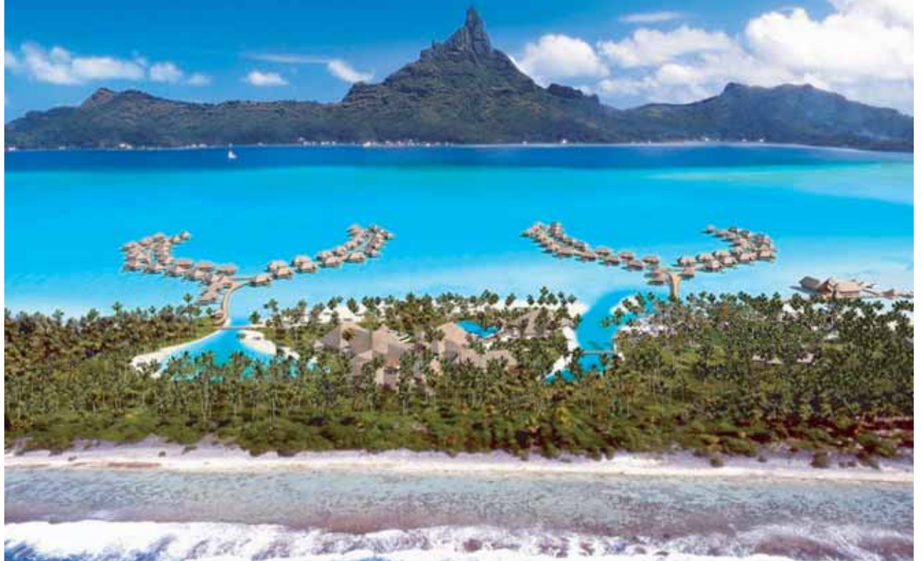
InterContinental Bora Bora