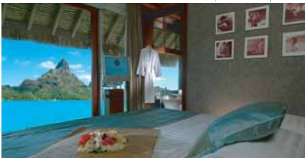
InterContinental Resort Thalasso & Spa Bora Bora | Suite

Día 12. España. Llegada y fin de nuestros servicios.