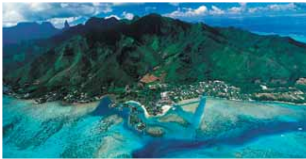
InterContinental Resort & Spa Moorea