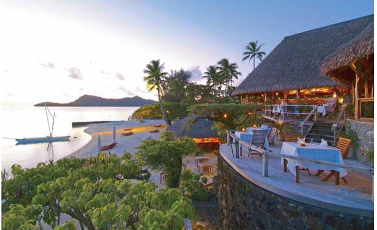
Hotel Bora Bora | Matira Terrace Restaurant