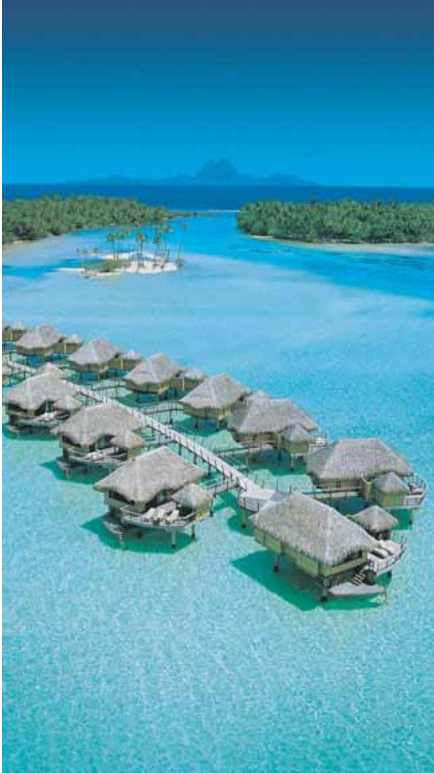
Le Taha'a Private Island & Spa