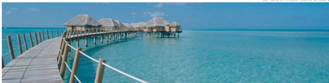
Le Taha'a Private Island & Spa

Precios basados en tarifas de hotel para Lunas de Miel