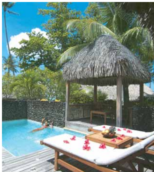
Hotel Bora Bora | Pool and Spa

Día 12. España. Llegada y fin de nuestros servicios.