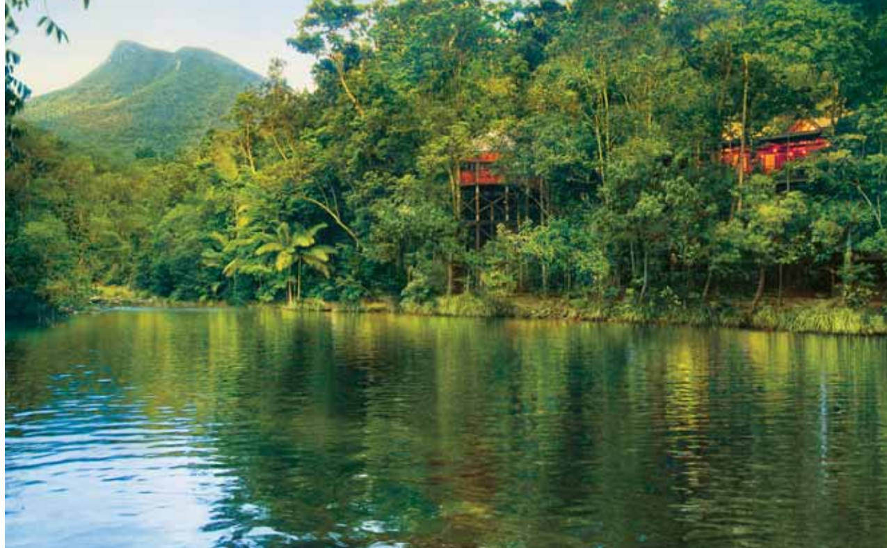
Daintree: Silky Oaks Lodge