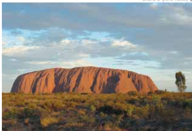
Uluru (Ayers Rock)