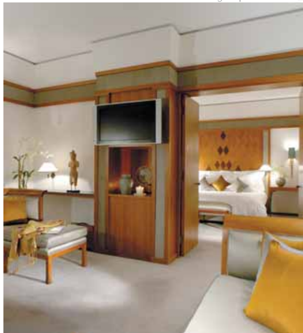
The Sukhothai Bangkok | Deluxe Suite