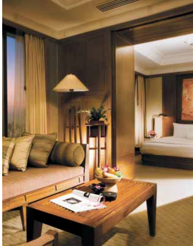
Banyan Tree Bangkok | Deluxe Suite