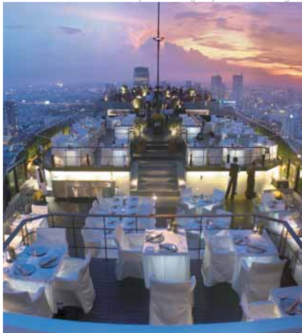
Banyan Tree Bangkok | Restaurante Vértigo