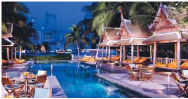
The Peninsula Bangkok | Pool