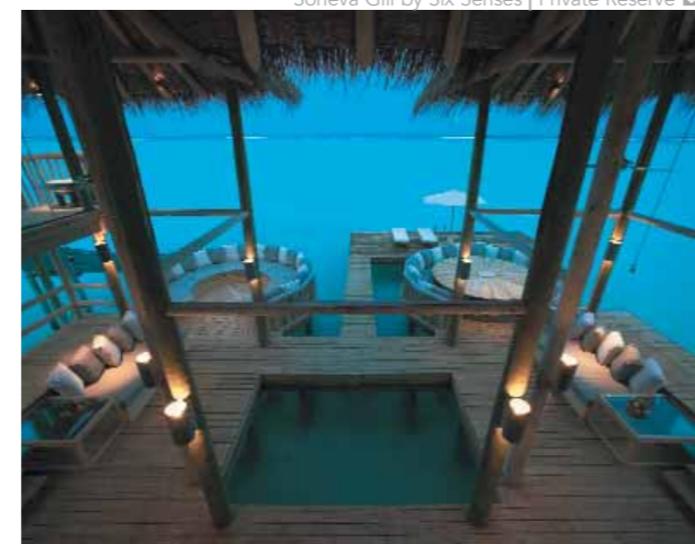
Soneva Gili by Six Senses | Private Reserve