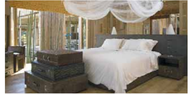
Soneva Kiri | Private Beach Reserve - Master Bedroom