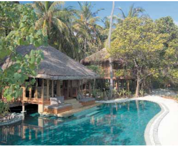
Soneva Fushi by Six Senses | Jungle Reserve