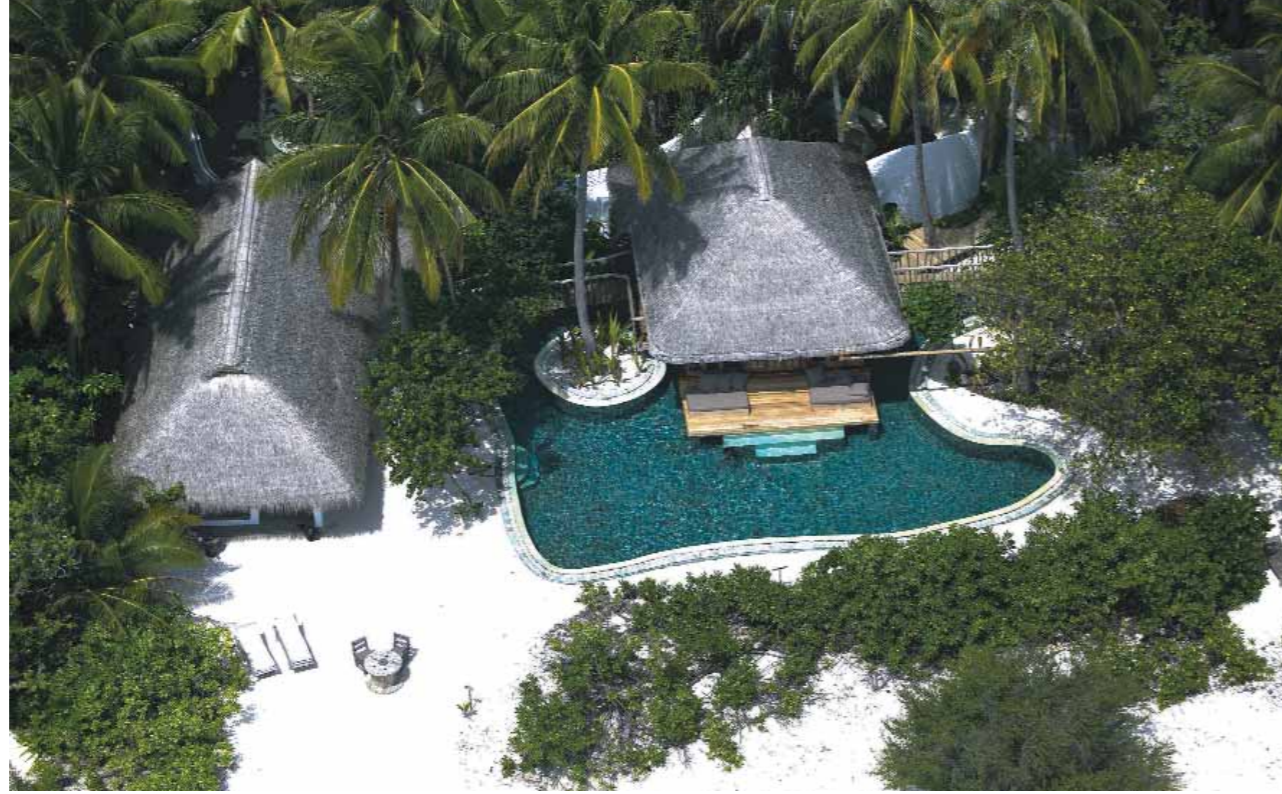
Soneva Fushi by Six Senses | Jungle Reserve

En cinco de sus hoteles, Six Senses ha edificado las denominadas Reserves, espectaculares villas con capacidad de hasta 12 personas que suponen en una posibilidad de alojamiento extremadamente lujosa y a la vez íntima, lo que se podría llamar un auténtico 'hotel dentro del hotel'. Cada una de estas villas tiene su propio carácter, si bien tienen en común la privacidad más absoluta y un personal con dedicación exclusiva que hará que se sienta como en su casa y atenderá a sus mínimas necesidades.