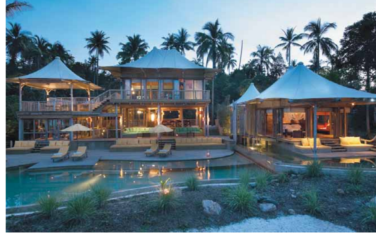
Soneva Kiri by Six Senses | Private Beach Reserve